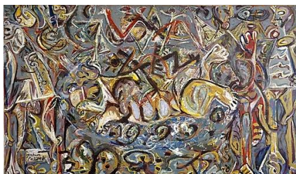
J. POLLOCK, Pasiphaë , 1943