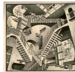
M.C. ESCHER, Relatività , 1953